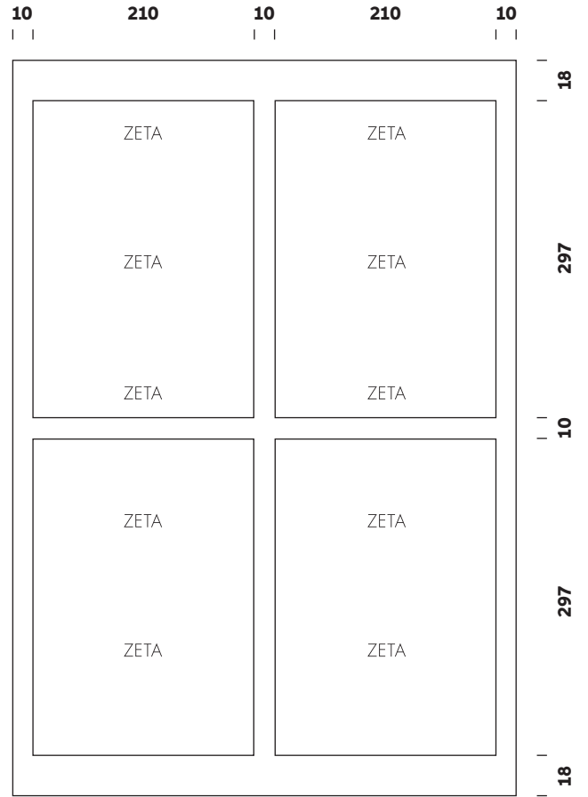
450 x 640 mm